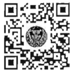
หนังสือนัดประชุม และระเบียบวาระการประชุม สภาผู้แทนราษฎร

การนัดประชุมได้แจ้งให้สมาชิกทราบทางสื่ออิเล็กทรอนิกส์เรียบร้อยแล้ว และท่านสมาชิกสามารถอ่านเอกสารประกอบการประชุมสภาผู้แทนราษฎรได้ โดยการสแกน QR Code หรือทาง www.parliament.go.th