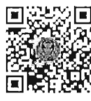
กระทู้ถามสด ด้วยวาจา